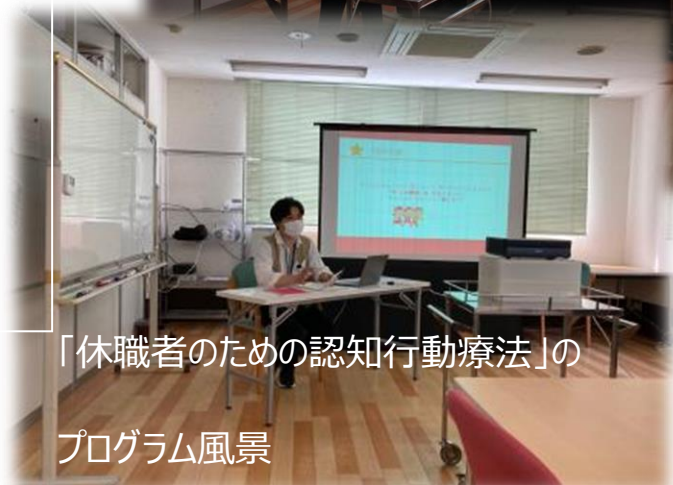
「休職者のための認知行動療法」のプログラム風景